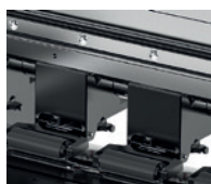
Riel guía de alta calidad