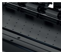
Sistema de succión