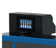
Dispositivo de alarma de escasez de tinta

Sistema automático y sincronizado de alimentación y recogida de bobina