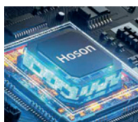
Placa Hoson duradera