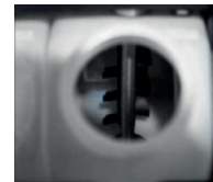
Circulación y agitación de tinta blanca