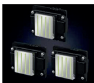
Cabezales EPSON i3200 x3

Sistema automático y sincronizado de alimentación y recogida de bobina