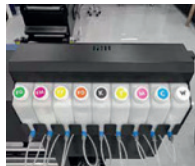
Impresión en 9 colores