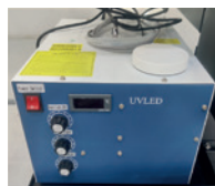
Sistema de curado UV LED refrigerado por agua de alta eficiencia