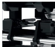
Retractor de potencia dual delantero y trasero